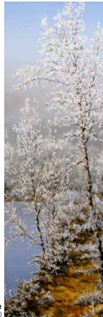
Galaverna tra le brume olio su tela cm 20x60