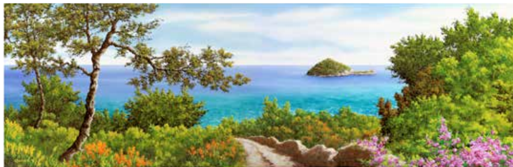
La Gallinara - olio su tela cm 120x40