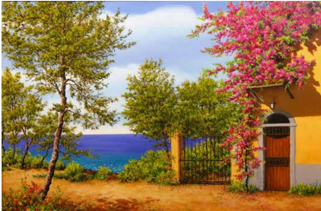
8 Attesa d'estate - olio su tela cm 90x60