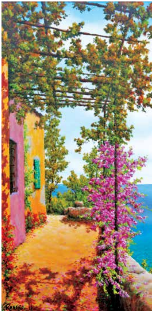
Balcone sul mare - olio su tela cm 30x60