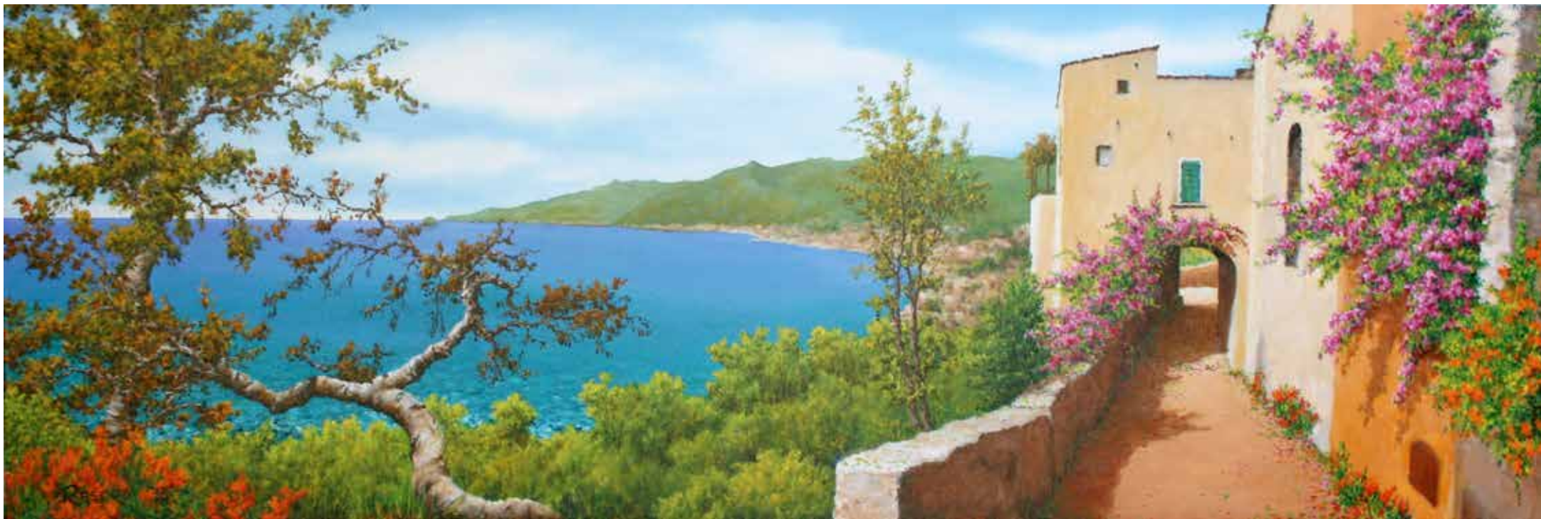
Affacciandosi da Crosa - olio su tela cm 120x40