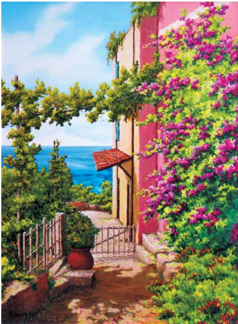
Bouganvillea in Liguria olio su tela cm 60x80

P iù di 400 pubblicazioni tra volumi d'Arte, enciclopedie, cataloghi e riviste specializzate riportano le sue opere e la sua attività. Citiamo per tutti i cataloghi nazionali "Il Quadrato", "COMED", "Arte moderna (Bolaffi)", "Art Diary", "Arte Mondadori", "Grandi Maestri", "Guida all'investimento artistico", ecc. Disponibile anche la monografia "Rasero" di Merlino Sara, Ed Astegiano, 2009.