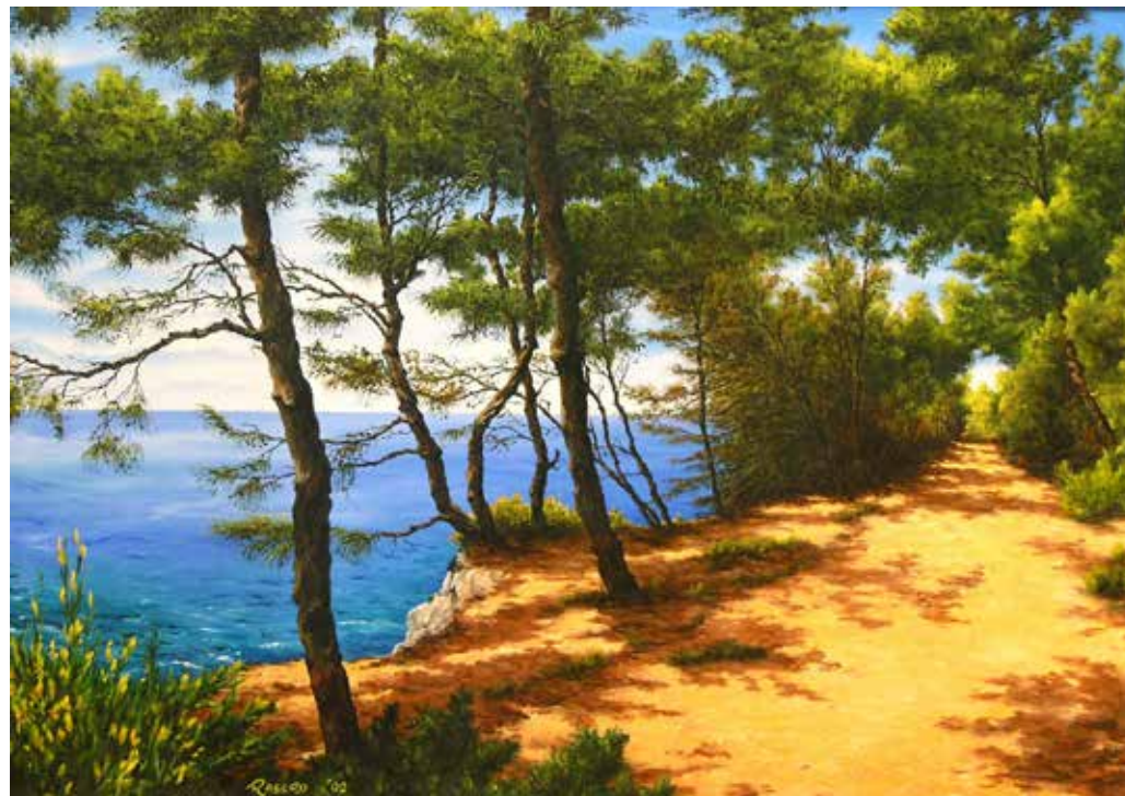
Ile de Sainte Marguerite - olio su tela cm 70x50

M embro di autorevoli Accademie, ha ricevuto premi e riconoscimenti; sue opere fanno parte di svariate collezioni private, in Europa (dalla Norvegia alla Spagna, dalla Finlandia alla Germania) e anche al di fuori dell'Europa (dall'Australia al Canada, dal Sudafrica agli Stati Uniti al Venezuela) e sono presentate al Sharjah art Museum degli Emirati Arabi Uniti, su invito del direttore Hisam al Madhloum, al Museum of Americas di Miami negli USA e al Museo Internacional de Arte Venado Tuerto, Santa Fe (Argentina).