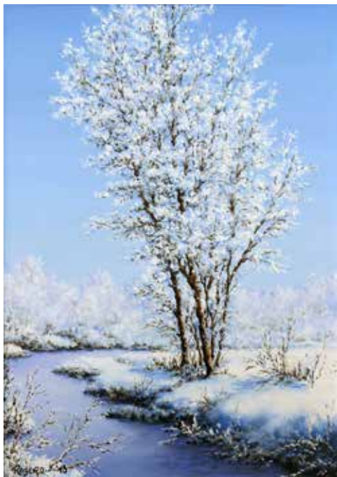
Incantato silenzio olio su tela cm 25x35