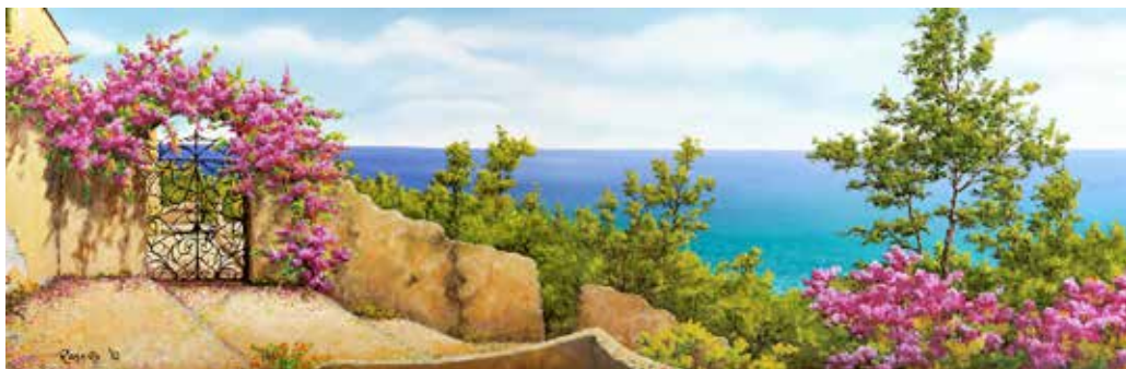
Cancello fiorito - olio su tela cm 120x40