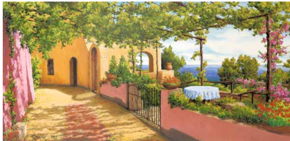
Patio sul mare - olio su tela cm 80x40