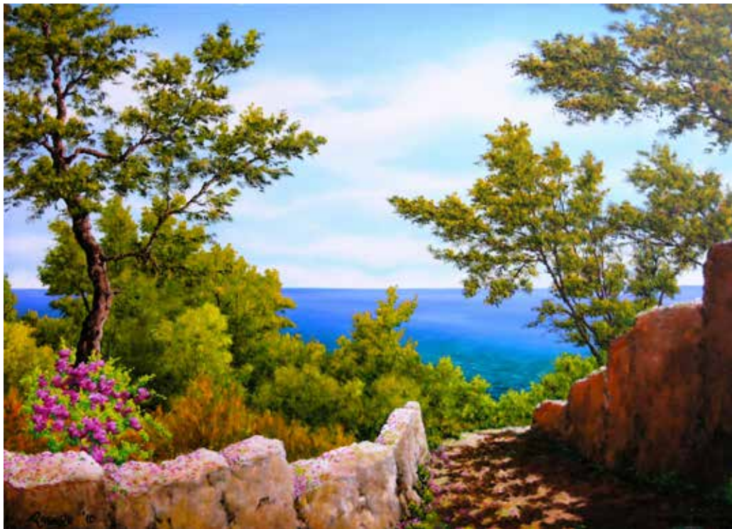
Sentiero verso il mare - olio su tela cm 70x50