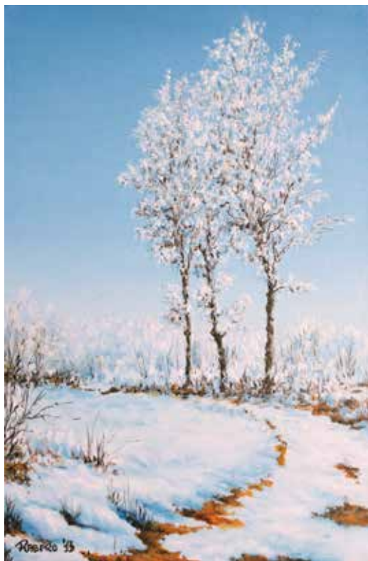
Campagna innevata olio su tela cm 20x30