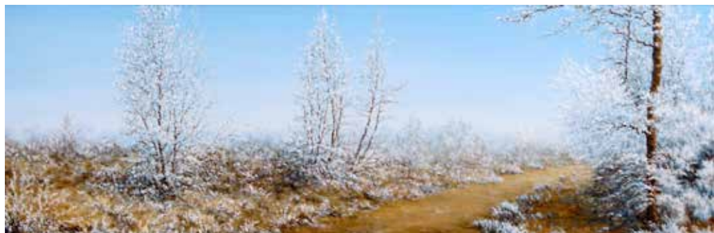
Ricami di brina - olio su tela cm 120x40