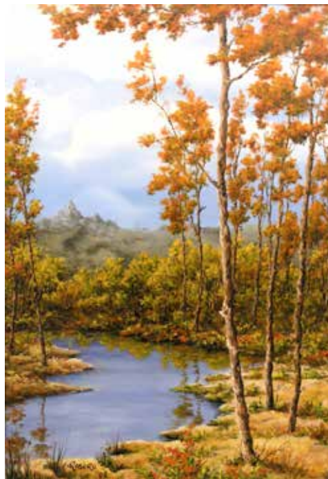
Lanca del Po in autunno olio su tela cm 25x35