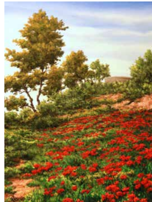
Rosso primavera olio su tela cm 30x40