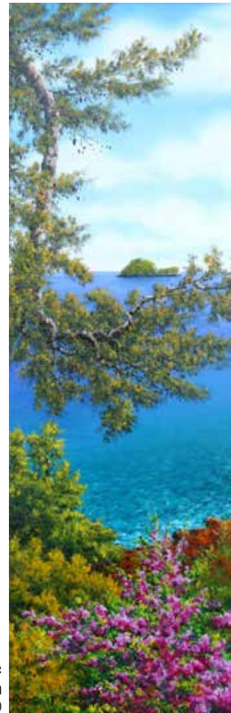
9 Tra le fronde olio su tela cm 20x60