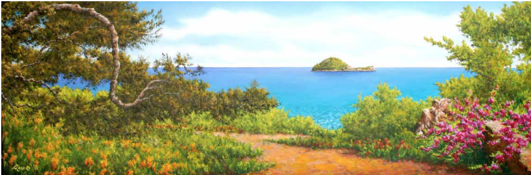
Dalla Julia Augusta - olio su tela cm 120x40

L'intenzione sottaciuta dell'artista pare a noi quella di inquadrare gli scorci di paesaggio in "un'atmosfera sospesa", alla ricerca di segni, tracce della sopravvivenza di un pacifico convivere tra presenza dell'uomo e natura. E' come se Rasero cercasse un senso diverso del tempo e del vivere rispetto alla nostra quotidianità: senso fatto di attenzione, di necessaria lentezza, di capacità di osservare ed ascoltare. Su questa china può succedere che l'osservatore cada nell'inganno dell'evasione, della fuga nell'idillio.