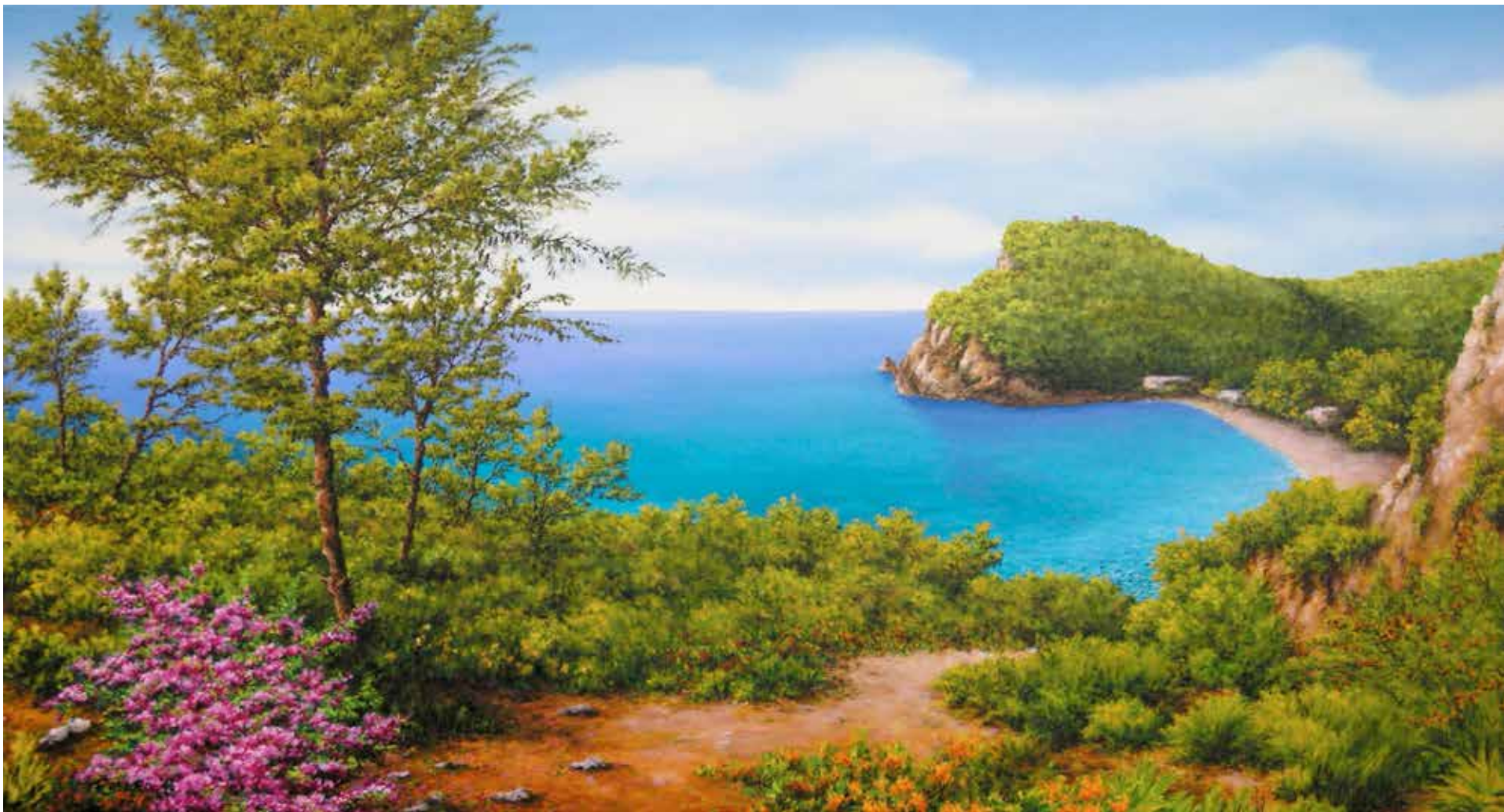
Baia dei Saraceni olio su tela cm 100x60