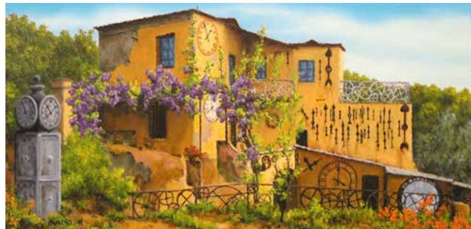
La casa degli orologi - olio su tela cm 60x30