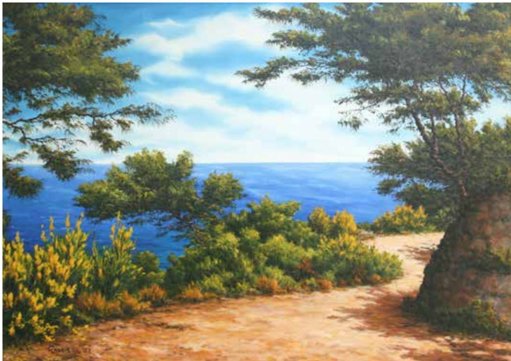
Ginestre in primavera - olio su tela cm 70x50