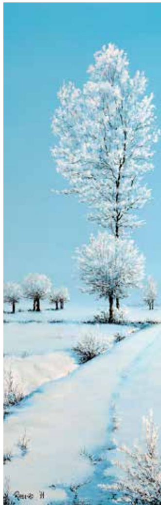
Brinata mattutina olio su tela cm 20x60